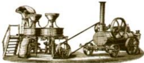
Primeras máquinas agrícolas