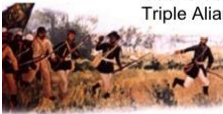
Guerra de la Triple Alianza