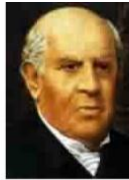
Domingo F. Sarmiento