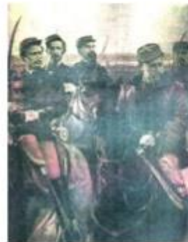
Roca y la campaña al sur