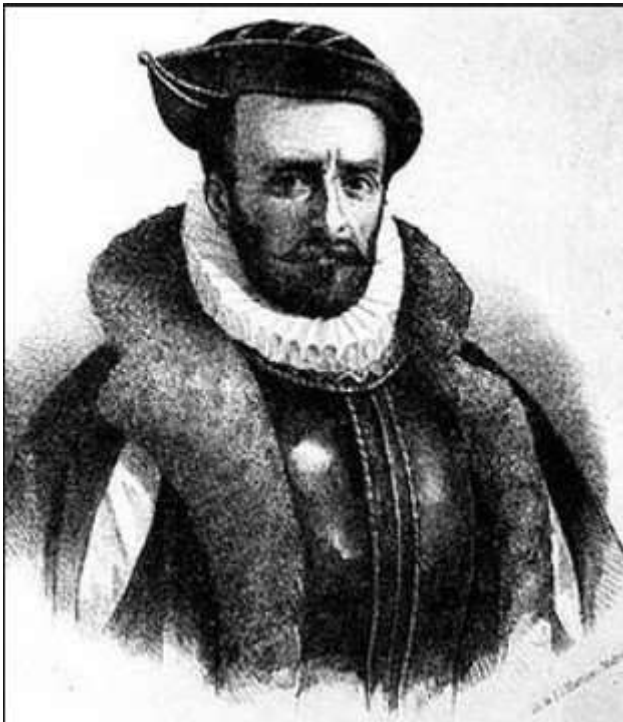
García Hurtado de Mendoza

– Fundación de la Provincia de Mendoza 2 marzo 1561 El 2 de marzo de 1561 Pedro del Castillo fundó la ciudad de Mendoza del Nuevo Valle de La Rioja, la primera en la región cordillerana argentina, y cuyo nombre le fue puesto en homenaje al gobernador de Chile, García Hurtado de Mendoza, y a su propia tierra de origen, ya que Pedro del Castillo había nacido en la provincia española de La Rioja, nombre que le fue impuesto por ser bañada por el Río Oja.